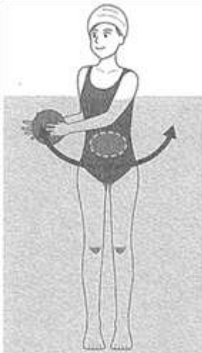
体の軸を動かさないようにしながら、お腹・背中・脇を意識し体をひねる

※トレーニングには様々な方法があり、個人差もありますので、効果に違いが出る場合もあります。あらかじめご了承ください。